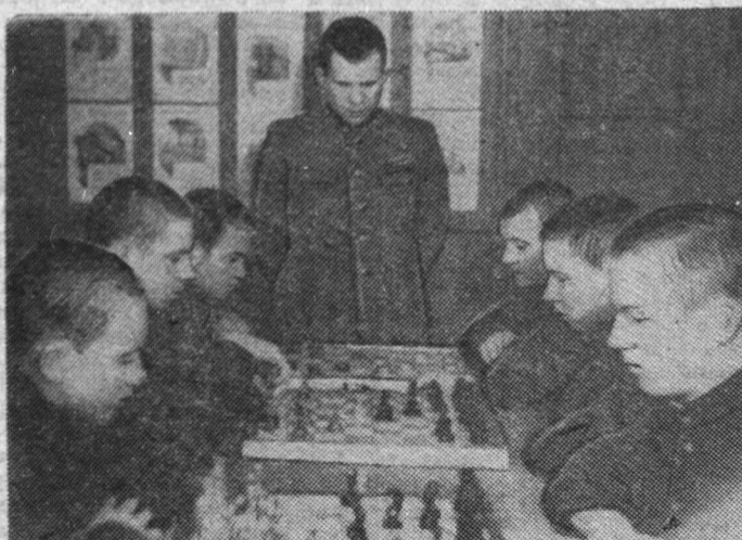
Фото и текст Н. НЕФЕДОВА.