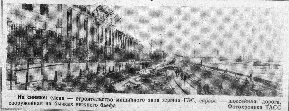
На снимке: слева — строительство машинного зала здания ГЭС, справа — шоссе, сооруженная на бычках нижнего бьефа.