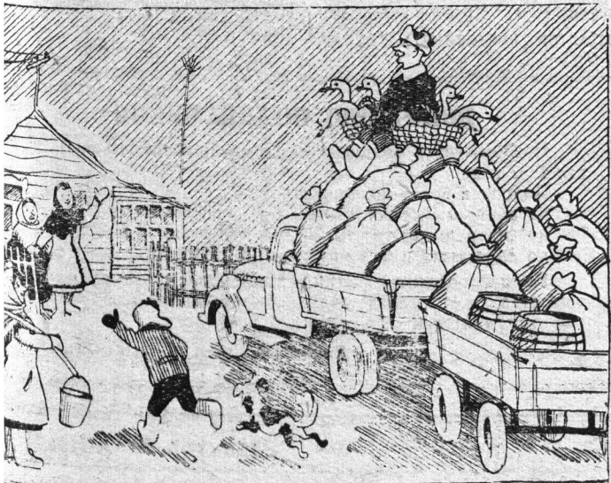
Зима, крестьянин торжествует...