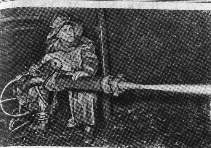
Кемеровская область. На угольных шахтах Кузбасса находит применение новый так называемый гидравлический способ добычи угля. Уголь из забоя водой подается в насосную, а оттуда на-гора на обогатительную фабрику. Отпадает необходимость в вагонетках, электровазгах, в большом штате обслуживающего персонала. Сейчас уже построена и действует гидрошахта «Польсаевская—Северная».