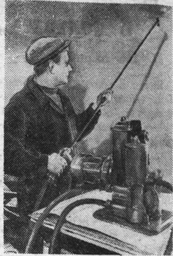
Одесский завод строительно-отделочных машин в этом году выпустит 15 видов отделочных машин. Большой интерес представляет электрокраскопульт С-491, предназначенный для механического распыливания известковых и водно-клевых красочных растворов. По сравнению с ручными насосами электрокраскопульт в три раза производительнее при лучшем качестве работы.

ниям вкладчиков, а также и оплаченные выигрыши по облигациям государственных займов в суммах до 500 рублей на облигацию. В сберегательной кассе при почтовом отделении пос. Рудничный введены операции по выдаче населению аккредитивов, что освобождает население поселка от поездок в г. Сланцы. Ф. СЕДАКОВ, заведующий центральной сберкассой Сланцевского района.