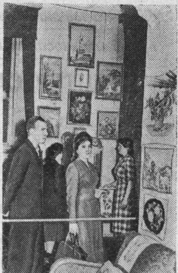
Брянск. Во Дворце культуры машиностроительного завода организована выставка работ самодеятельных художников, скульпторов и мастеров прикладного искусства. Здесь экспонируется свыше 300 произведений живописи, скульптуры, резьбы по дереву, кости и пластмассе, художественная вышивка и много другого. Выставка пользуется большим успехом. На снимке: посетители осматривают выставку.

В актовом зале Московского университета 4 апреля открылась всесоюзная научно-техническая конференция по применению радиоактивных и стабильных изотопов и излучений в народном хозяйстве и науке. В конференции принимает участие около четырех тысяч работников науки и промышленности. Присутствуют иностранные ученые, прибывшие из Албании, Англии, Болгарии, Венгрии, Германской Демократической Республики, Индии, Китайской Народной Республики, Кореи, Народной Демократической Республики, Монгольской Народной Республики, Польши, США, Чехословакии. Конференцию открыл главный ученый секретарь президиума Академии наук СССР академик А. В. Топчиев. Доклады, включенные в программу конференции, освещают результаты применения изотопов и излучений в самых разнообразных отраслях хозяйства и науки. (ТАСС)