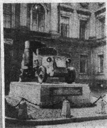
Ленинград. Броневик, установленный у входа в музей В. И. Ленина. 3(16) апреля 1917 г. у Финляндского вокзала с этого броневика прозвучал великий призыв В. И. Ленина: «Да здравствует социалистическая революция!».