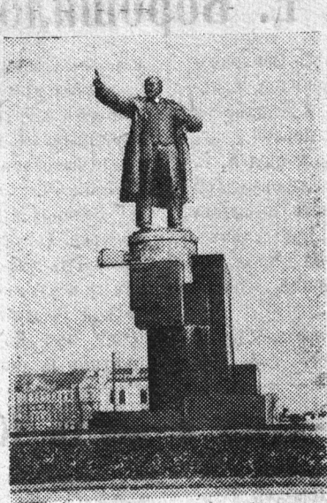
Памятник В. И. Ленину в городе Ленинграде на площади у Финляндского вокзала.

И вот, наконец, наступил долгожданный день приезда Владимира