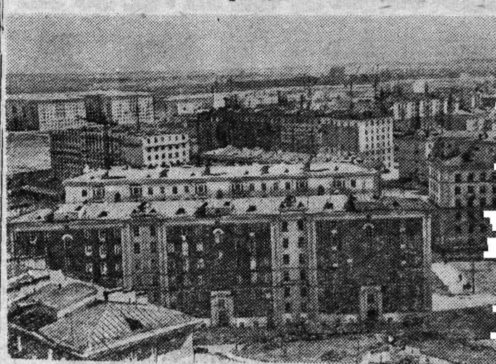
Ленинград. Вид на новые дома в Московском районе.