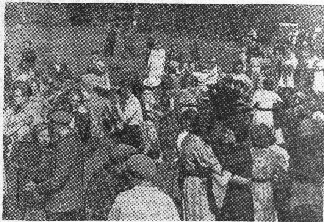
На месте бывших руин вновь поднялся социалистический город Сланцы. Там, где совсем недавно шумел дремучий лес или лежали груды развалин, сейчас раскинулся город шахтеров и газовщиков, город юности. Весело и хорошо на его благоустроенных зеленых улицах. Привольно на его живописных окраинах. Тысячи трудящихся в выходные дни выезжают сюда на отдых.

На снимке: на районном празднике передовиков сельского хозяйства.