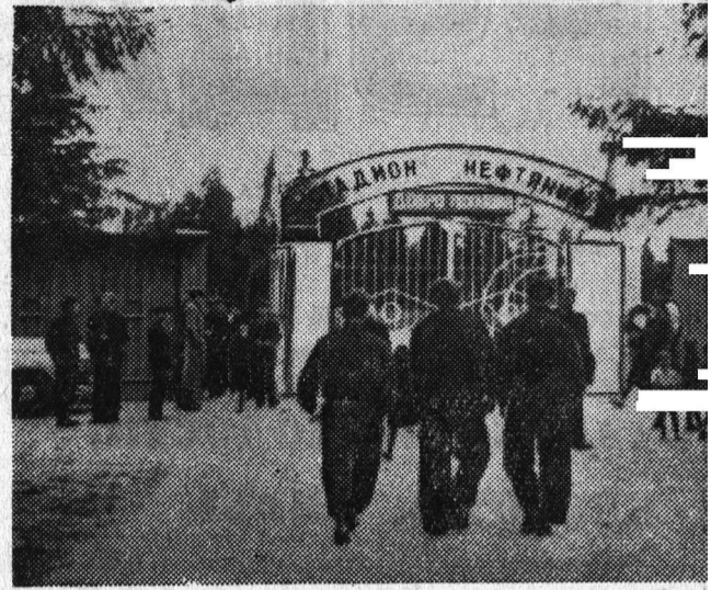
На снимке: у главного входа стадиона «Нефтяник».