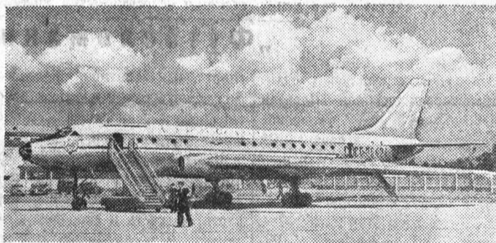
На снимках: (вверху) новые пассажирские самолеты «ТУ-110» (слева), «Москва» (справа) и «ТУ-104 А» (внизу) на Внуковском аэродроме города Москвы.

Новейшие советские воздушные корабли оборудованы совершенной аэронавигационной аппаратурой, позволяющей летать в самых сложных метеорологических условиях и ночью.