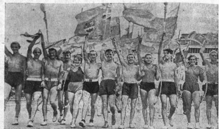
Группа участников VI Всемирного фестиваля молодежи и студентов и III Международных дружеских спортивных игр молодежи на Центральном стадионе имени В. И. Ленина.