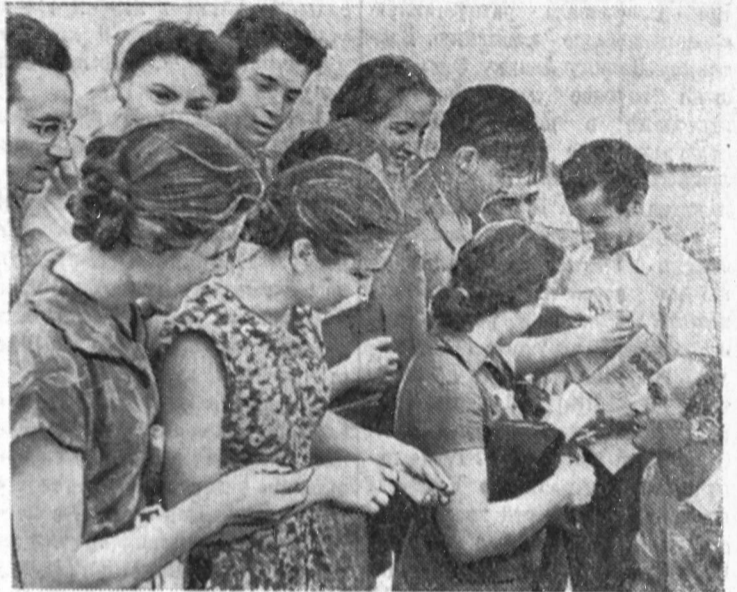
В Москву на VI Всемирный фестиваль молодежи и студентов ежедневно прибывают многочисленные зарубежные делегации.

На стадионе возникает овация. Слово предоставляется Председа-