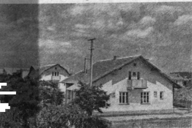
Украинская ССР. Многие трудящиеся Львова по привычке сами строят себе дома. За последнее время здесь появились новые улицы: Машинистов, Строительная и другие. В районе улицы Пасечной недавно заложен поселок на 100 квартир, четырех- и восьмиквартирных домов. Всего в городе уже построено 2 тысячи квартир. Сотни семей рабочих и служащих Львовского железнодорожного узла и промышленных предприятий встретят 40-ю годовщину Великого Октября в новых домах. На снимке: новые дома по улице Машинистов.

Рабочие шахты № 3 постоянно помогают колхозу «Шахтер» в выполнении различных работ.