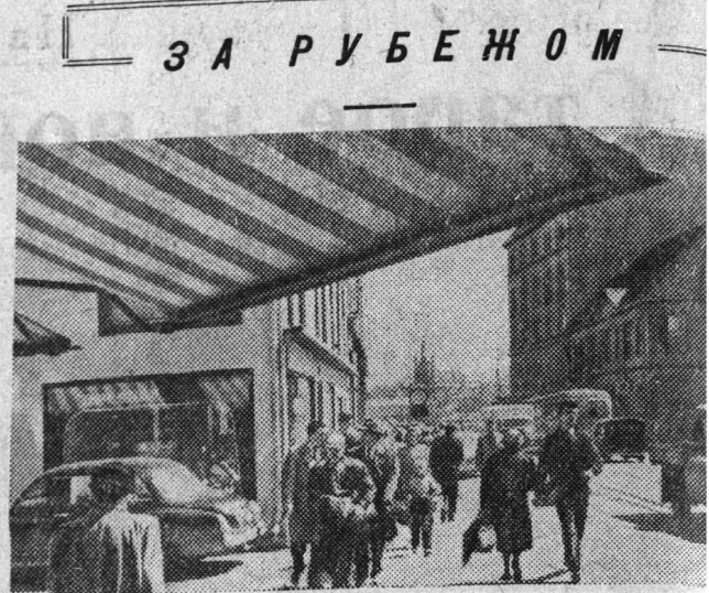
Норвегия. В центре города Осло.