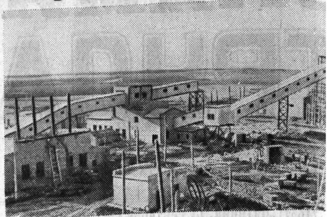
Ворошиловградская область. Крупную трудовую победу в соревновании за достойную встречу 40-летия Советской власти ждали посланцы комсомола Киевской области. По призыву правительства они приехали в пород Ровеньки в январе этого года за восемь месяцев построили здесь шахту «Киевская-копская» № 1.

На снимке: общий вид шахты-новостройки «Киевская-копская» № 1.