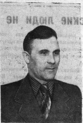
Один из многих

Напряженно трудятся в эти дни энергетики теплоэлектроцентрали газосланцевого завода. Воодушевленные приближением всенародного праздника — славной 40-й годовщины Великого Октября, они изо дня в день повышают производительность труда и стремятся встретить историческую дату высокими трудовыми подвигами.