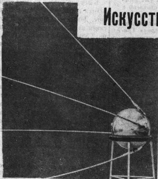
Советский искусственный спутник Земли (спутник показан на подставке).

С 4 октября вокруг Земли движется рожденный гением человеческой мысли ее искусственный спутник. К 11 октября он уже сделал почти 100 оборотов вокруг Земли.