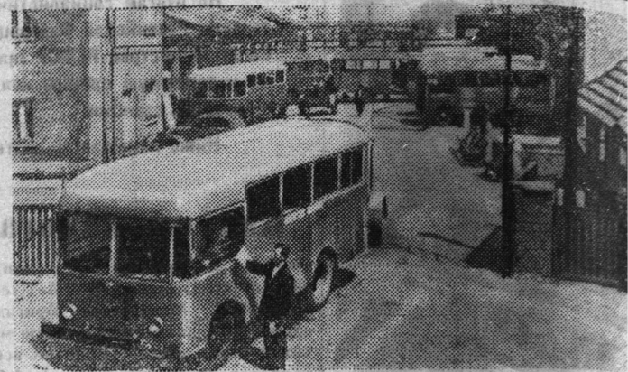
Польская Народная Республика. Государственный завод по монтажу сельскохозяйственных машин в воеводстве Зеленогурском выпускает передвижные ремонтные мастерские. Их устанавливают на рамах грузовика «Стар». Мастерские снабжены различными инструментами. С их помощью можно производить непосредственно на полях ремонт тракторов, комбайнов и других сельских машин. На снимке: передвижные ремонтные мастерские.