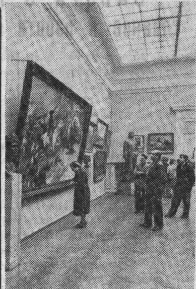
Юбилейная выставка работ ленинградских художников в Русском музее.