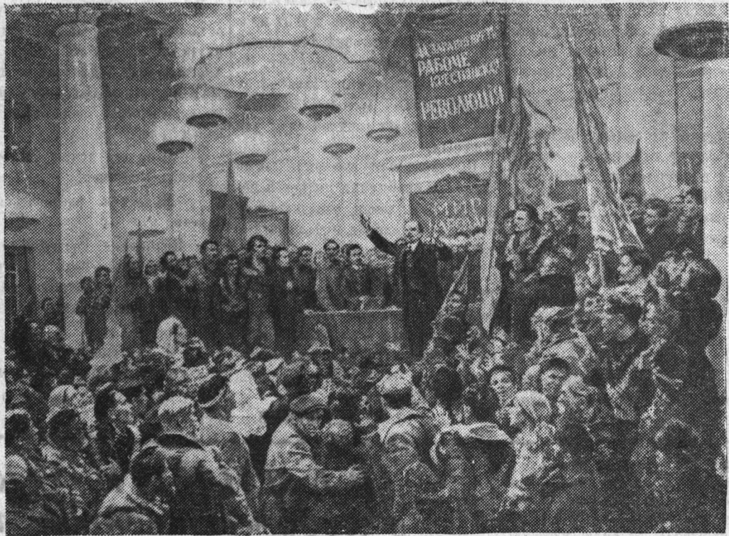
Юбилейная выставка работ ленинградских художников в Русском музее. На снимке: «Провозглашение Советской власти» — новая картина художника А. Н. Самохвалова.

«Ленин вечно живой» — эти слова написаны под портретом великого вождя, изображенного на фоне кремлевской стены. Портрет выполнен художником-плакатистом М. Гордоном.