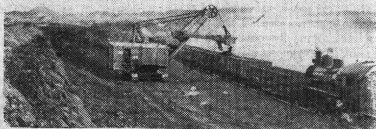
Казахская ССР. Горняки треста «Иртышуголь» с каждым днем увеличивают добычу угля.

На снимке: погрузка добытого угля в вагоны.