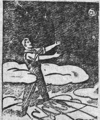
— Высоко взметнул... к звездам!

Период обращения второго спутника равен 103,52 мин. Он уменьшается значительно медленнее. За одни сутки уменьшение периода обращения второго спутника составляет 2,3 секунды. Наибольшая высота его орбиты равна 1.650 километрам.