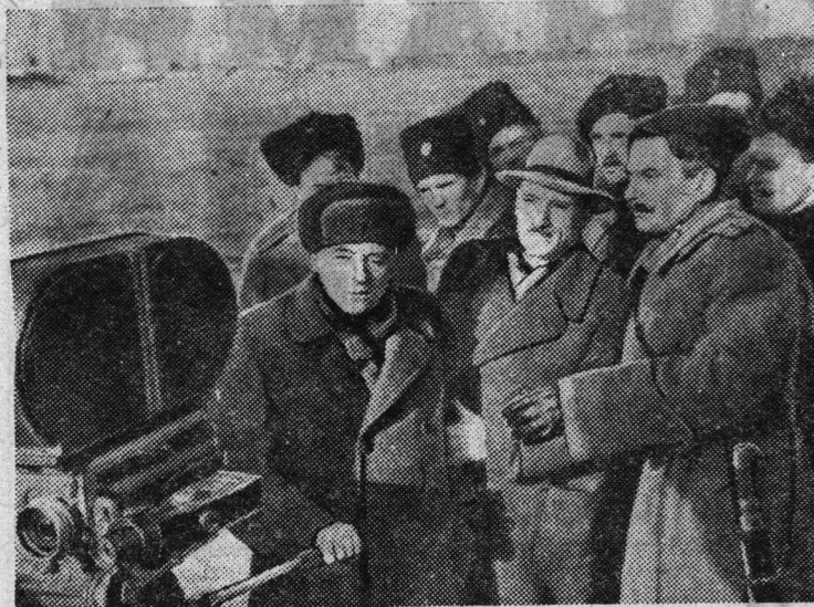
«В Одесском морском торговом порту идут съемки третьей серии кинофильма «Тихий Дон».