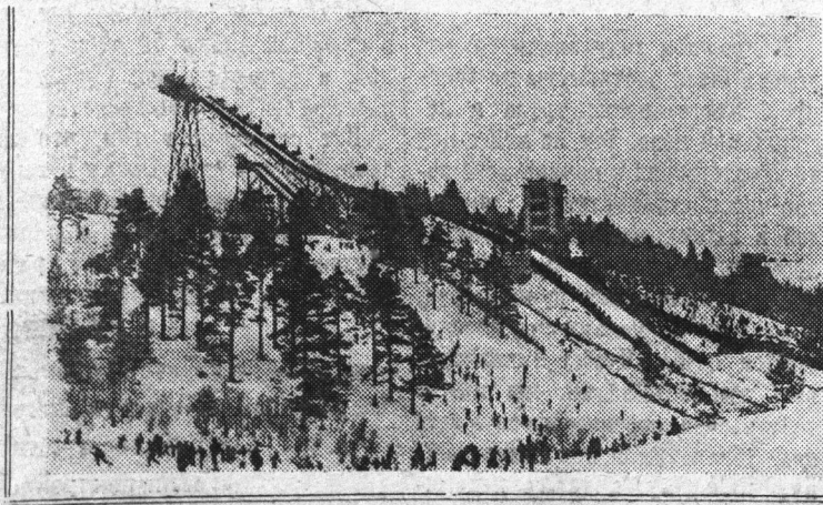
В Кавголово, близ Ленинграда, вступил в строй новый лыжный трамплин, один из крупнейших в Советском Союзе.

В принятой резолюции собрание актива наметило пути улучшения выполнения решений декабрьского Пленума ЦК КПСС по улучшению работы предприятий и строек района.