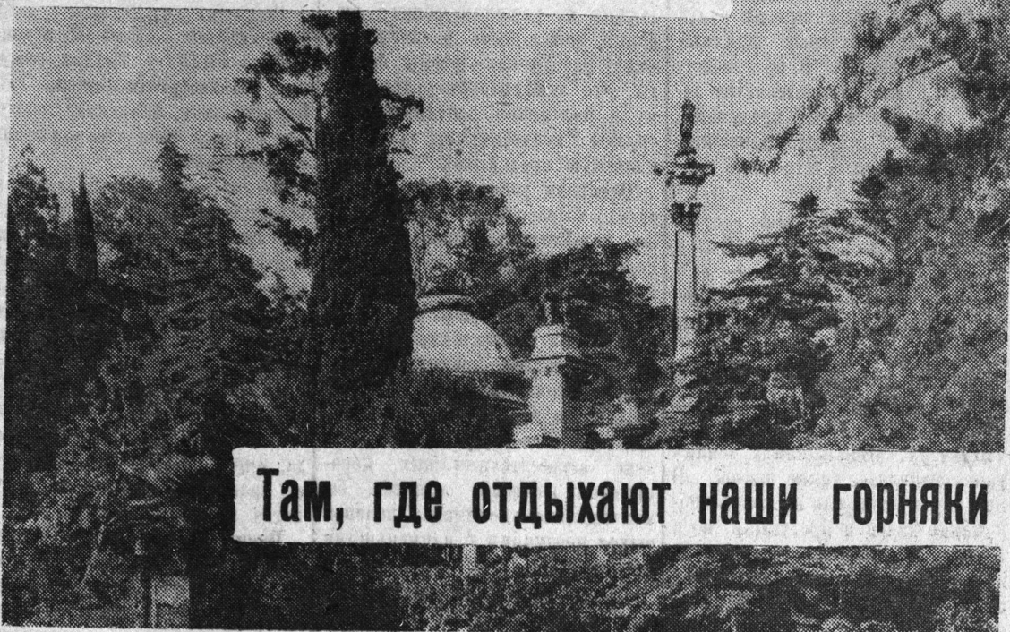
Там, где отдыхают наши горняки

Хорошо отдохнули. Бодро и жизнерадостно чувствуем себя!