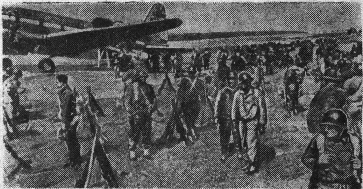
Куба. Террористический режим диктатора Батисты держится исключительно на штыках армии.

ЛОНДОН. (ТАСС). Забастовка на шахте Бинли в районе Ковентри, объявленная 4 марта в знак протеста против увольнения трех шахтеров, распространилась на другие шахты в графстве Уорикшир. Как сообщает агентство Пресс Ассошиэйшн, всего в настоящее время бастуют 7 тысяч горняков, работающих на четырех шахтах этого района.