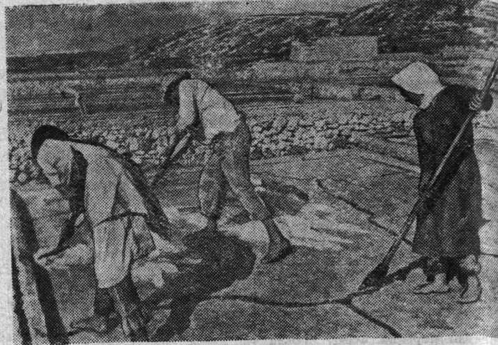
Ливан. На соляных промыслах вблизи города Триполи.