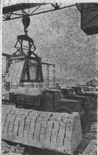
Калинин. Коллектив силикатно-кирпичного завода № 2, воодушевленный решениями декабрьского Пленума ЦК КПСС, в январе дал сверх плана один миллион штук кирпича для строек области. На снимке: погрузка кирпича в автомашины электрическим мостовым краном.