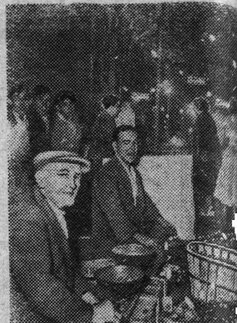
Испания. Гранада. Торговцы фруктами вечером на улице города.

Газета пишет, что в своем послании президент Насер подчеркнул, что, как это определено в резолюциях ООН, в задачу чрезвычайных вооруженных сил ООН не входит выполнение административных функций. Ввиду этого, говорится в послании президента, Египет назначил административного губернатора сектора Газы.