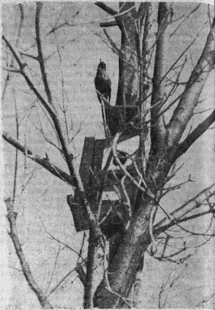
Фотоэтиюд И. Крылова.