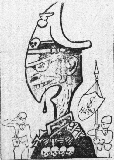
Лицо генерала Шпейделя. Рис. В. Гальба

ПАРИЖ. (ТАСС). В Фонтенбло (штаб-квартира НАТО под Парижем) бывший гитлеровский генерал Ханс Шпейдель официально вступил на пост командующего сухопутными войсками НАТО в Центральной зоне Европы.