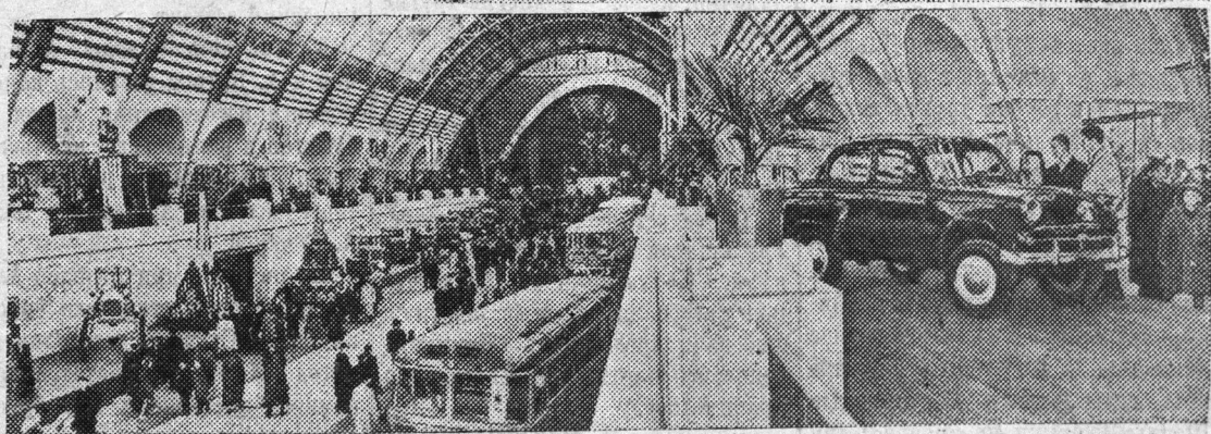
НА СНИМКАХ — в павильоне «Машиностроение».