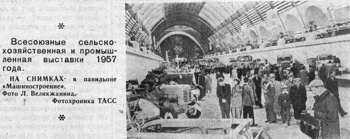
Всесоюзные сельскохозяйственная и промышленная выставки 1957 года.