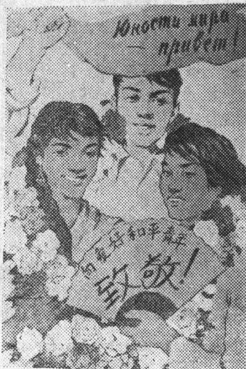
Плакаты: «Юности мира — привет!», художник К. Владимиров. (Издательство Изогиз).