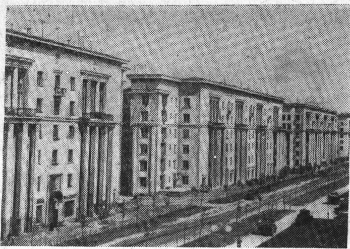
Ленинград. Шемиловка. Ивановская улица.