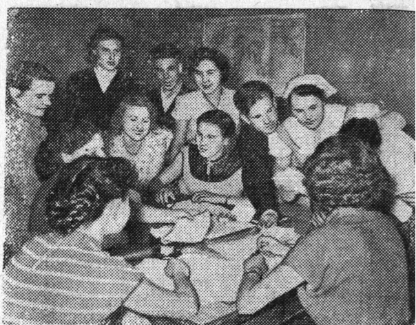
Куйбышев. Молодые рабочие Подшипникового за энтузиазмом встретили призыв комитета ВЛКСМ поехать на время летних полевых работ.

На снимке: молодые рабочие подают в комитет ВЛКСМ с просьбой послать их на целинные земли.