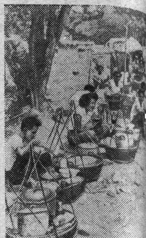
Таиланд. Торговля продуктами.

ХЕЛЬСИНКИ. (ТАСС). Газеты «Кансан уутисет», «Суомен социалидемократти» и «Хельсингин саномат» на видных местах опубликовали подробное изложение сообщения «О разработке перспективного плана развития народного хозяйства СССР». Газеты отмечают, что планирование развития народного хозяйства СССР на более длительный период связано с необходимостью более полного использования новых природных ресурсов страны. Подчеркивается, что Советский Союз стремится решить грандиозную задачу, поставленную XX съездом КПСС, — в исторически кратчайший срок догнать и перегнать наиболее развитые капиталистические страны по производству продукции на душу населения.