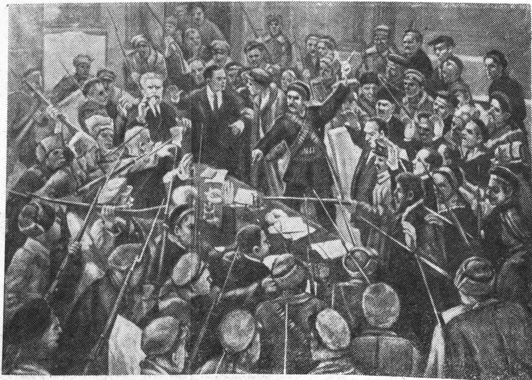
На снимке: арест Временного правительства в Зимнем.