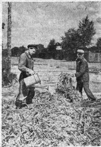
Химический способ силосования сочных кормов

В колхозе имени Ворошилова Балашихинского района Мо-сковской области в этом году проводят опыт химического си-лосования сочных кормов пу-тем полива закладываемой массы раствором серно-соляной кислоты (раствор 1:6) из рас-чета 70 литров раствора на од-ну тонну закладываемой зеле-ной массы. Такой способ си-лосования способствует лучшему сохранению в закладываемой массе белковых веществ и ви-таминов и исключает обяза-тельное измельчение заклады-ваемой массы.