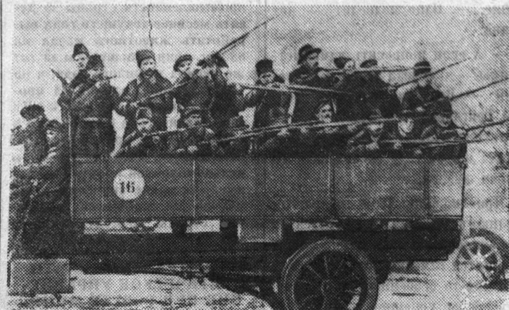
Красногвардейцы-путиловцы в октябрьские дни 1917 г.

А. И. ДАВИДЕНКО, начальник отдела Государственного исторического архива Ленинградской области. (ЛенТАСС)