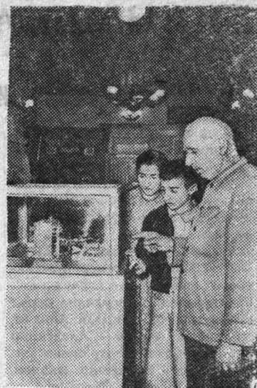
Армянская ССР. Музей установления Советской власти в Армени, находящийся в Иджеванском районе, хранит много интересных экспонатов.

Общее собрание колхозников наметило мероприятия по быстрейшему выполнению социалистических обязательств, принятых в честь 40-й годовщины Великого Октября. Решено в ближайшее время, до праздника, рассчитаться с государством по всем видам поставок, усилить темпы работ по завершению сельскохозяйственного года, всем колхозникам активно включиться в соревнование, обеспечить непрерывное повышение продуктивности общественного животноводства, образцово начать зимовку скота, создавать прочную основу высокого урожая будущего года.