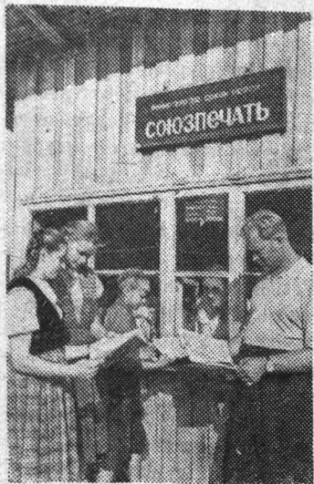
Ленинградская область. У книжки «Союзпечать» в городе Лесогорске.