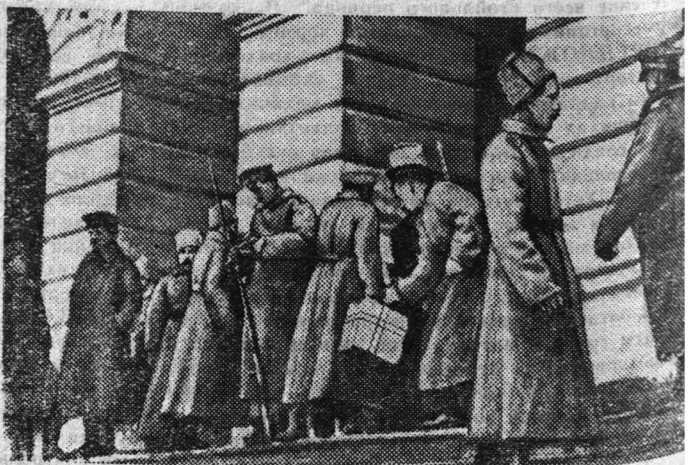
На снимке: у входа в Смольный. 1917 год.

В. ИВАНОВ, научный сотрудник института истории партии при Ленинградском обкоме КПСС. (ЛенТАСС)