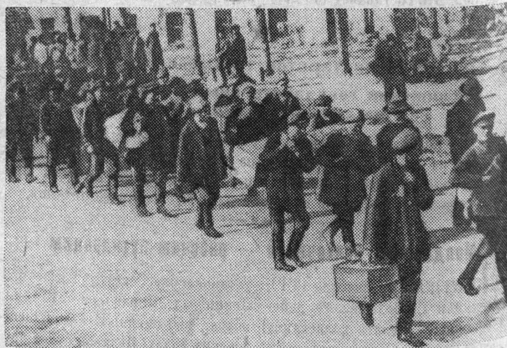
1-й полк «Деревенской бедноты» проходит по двору Смольного. 1917 г.