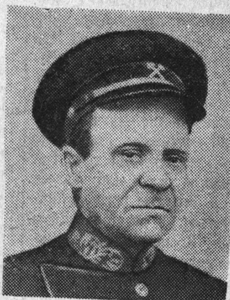
текст А. Михалова.

Такая забота о людях возможна только в стране Великого Октября, в стране победившего социализма.