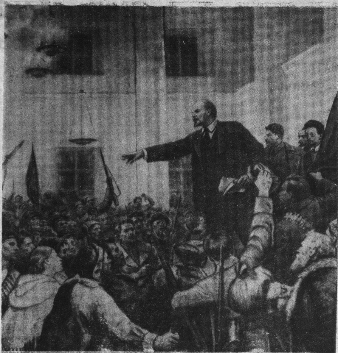
С картины художника В. Серова «В. И. Ленин провозглашает Советскую власть».