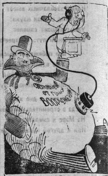
Чревовещание по вопросам разоружения.