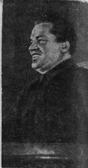
С. М. Киров.

Одна из комнат отведена под экспонаты, показывающие деятельность С. М. Кирова в период Октябрьской революции и гражданской войны. Сергей Миронович был одним из организаторов Советской власти на Кавказе, возглавлял героическую оборону Астрахани. Вот анкетный лист делегата X Всероссийского съезда Советов. В графе «профессия» С. М. Киров указывает: «Революция». Экспонируется поздравительная телеграмма, посланная Кировым и Орджоникидзе В. И. Ленину в день его пятидесяти-