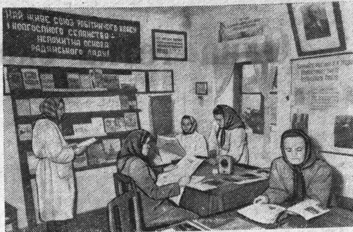
Тернопольская область. При животноводческой ферме колхоза имени Ворошилова Козовского района оборудован красный уголок. Животноводы проводят здесь

часы досуга, читают газеты и журналы, слушают радио.