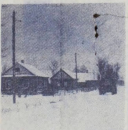
Текст А. Михалова.