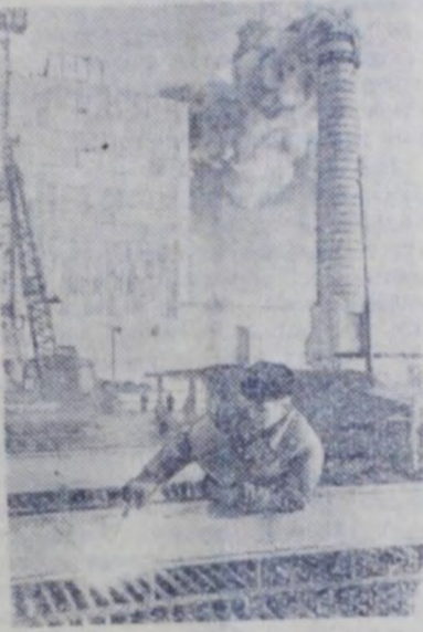
Минская область. Коллектив строительного управления треста «Севэнергострой» в канун 40-й годовщины Великого Октября сдал в эксплуатацию первый турбогенератор Смоленской ГРЭС. Сейчас строители борются за досрочный ввод в действие очередного турбогенератора.

Нет сомнений в том, что XI районная партийная конференция пройдет на высоком уровне. Она будет способствовать лучшей мобилизации коммунистов, всех трудящихся района на успешное выполнение задач хозяйственного и культурного строительства.