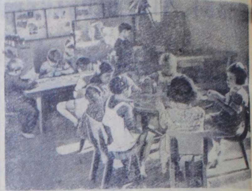
Федеративная Народная Республика Югославия. В одном из детских садов города Загреб (Народная Республика Хорватия).

Вечером в конференц-зале Каирского университета состоялось заключительное заседание конференции.