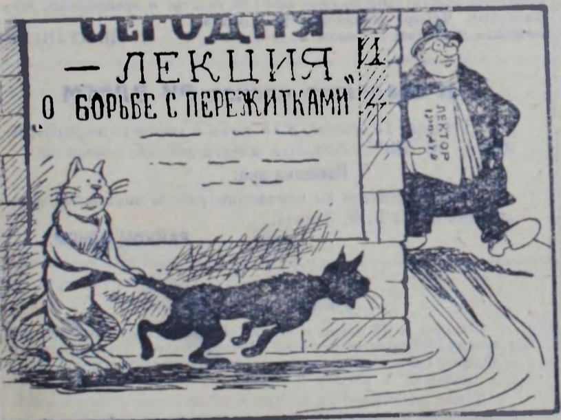
— Не перебегай дорогу — сорвешь лекцию!

Л. ПОПОВ, Улица Свердлова, дом № 1-8, кв. № 1.