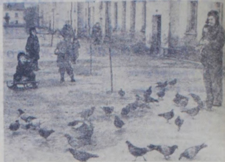
Забота о голубях

За внедрение аэроионотерапии взялись также в Москве, Тарту, Риге, Куйбышеве, Кишиневе, Ялте. В этой области работают в контакте физиологи и физики, врачи-терапевты и курортологи. Проблема решается комплексно. То