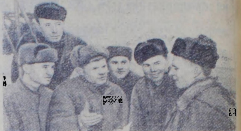
Кировоградская область. Следуя патриотическому почину краснодонских горняков, шахтеры буроголиных предприятий треста «Александряуголь» берут новые повышенные обязательства и успешно выполняют их.

Н. ШИРИН, инструктор Сланцевского райкома КПСС.