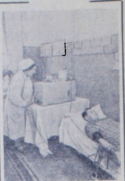
Ленинград. В этом году исполняется 34 года со дня организации в Ленинграде научно-исследовательского института гигиены труда и профессиональных заболеваний. За время своего существования институтом успешно были разработаны важнейшие вопросы гигиены труда в машиностроении, судостроении, горнорудной и химической промышленности.