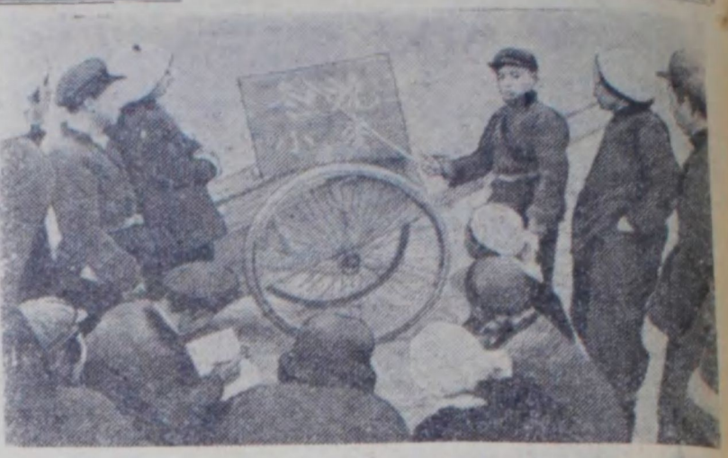
Во многих производственных сельскохозяйственных кооперативах Китайской Народной Республики в период зимних работ созданы учебные группы по ликвидации неграмотности. После работы крестьяне целыми производственными бригадами учатся читать и писать. На снимке: члены кооператива в уезде Ляо Чен (провинция Шаньдун) за изучением иероглифов в поле