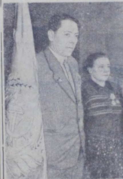
Ленинградская область. В социалистическом соревновании колхозов области за 1957 год первое место занял колхоз «Большевик» Гатчинского района. В колхозе от каждой коровы надоено по 5.293 килограмма молока, или на 489 килограммов больше, чем в 1956 г. Колхозу вручено переходящее Красное знамя обкома КПСС и облисполкома и выдана денежная премия