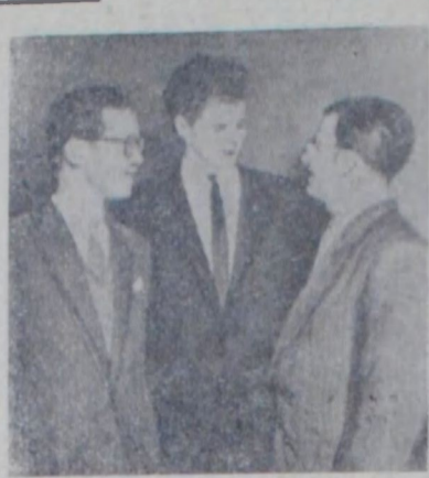
Международный конкурс пианистов и скрипачей имени П. И. Чайковского.

Ансамбль участвовал в фестивале ансамблей хоровых и драматических коллективов страны, посвященном 40-летию Великой Октябрьской социалистической революции. За успехи в работе кол-