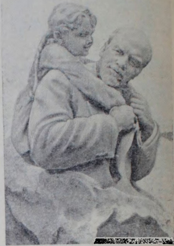
Скульптура З. И. Азгура «В. И. Ленин».

К 88-й годовщине со дня рождения В. И. ЛЕНИНА