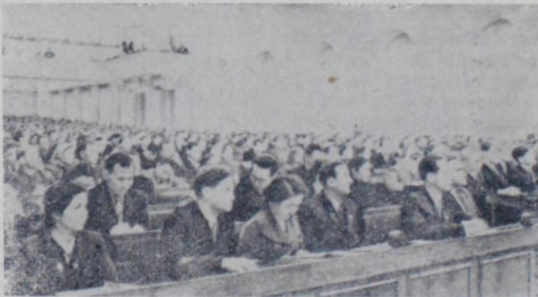
Москва. В Большом Кремлевском дворце. На снимке: в зале заседаний съезда