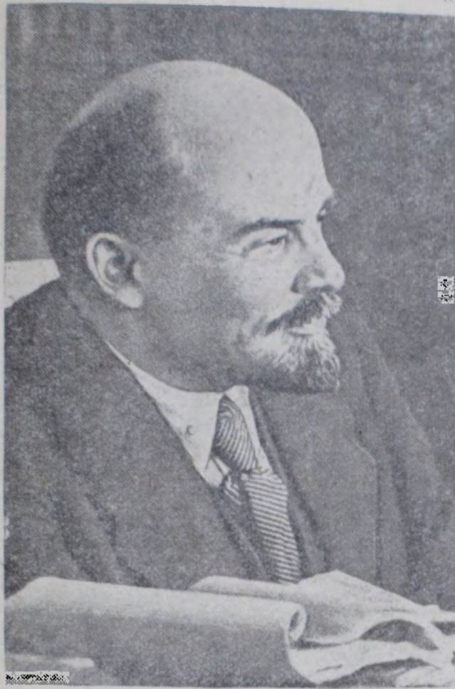
В. И. ЛЕНИН.

Озаренная немеркнувшим светом идей марксизма-ленинизма, наша великая Родина могучей поступью идет вперед, к победе коммунизма.