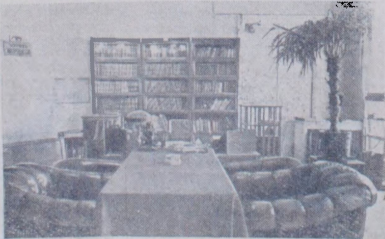
Москва, Кремль. Рабочий кабинет В. И. Ленина.

Ле с Высоких го Не для о Из поколе Они несут Наследие Источни Живое по Звучит со Трудясь, ш И мы ства Несем в Венчанное С портрета