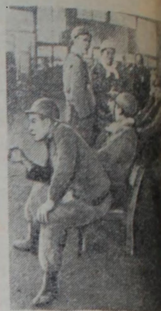
Япония. Басгующие горняки шахте Юбари (остров Хоккайдо).

ПАРИЖ. (ТАСС). Газета «Юманите» опубликовала заявление Политбюро Центрального Комитета Французской коммунистической партии о результатах первого тура кантональных выборов. Подчеркнув успех Коммунистической партии на этих выборах, Политбюро указывает, что, «голосуя за кандидатов Коммунистической партии в первом туре выборов, около 2 миллионов французов и француженок высказались за политику мира и социального прогресса, которую постоянно защищает Коммунистическая партия. Они выразили свою решимость путем переговоров положить конец алжирской войне, которая разрушает страну и подрывает ее бу-