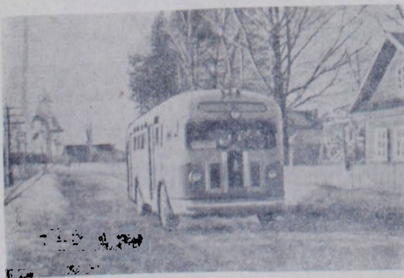
Ленинградская область. Открыты новые автобусные маршруты Ленинград — Осьмино, Ленинград — Сланцы. На снимке: автобус на улице Ленина в селе Осьмино.