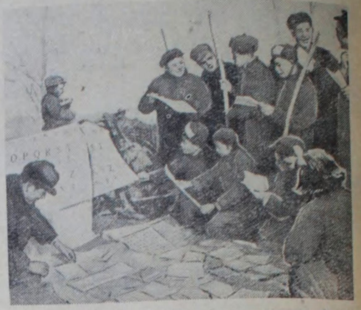
В Китайской Народной Республике проводится большая работа по ознакомлению населения с реформой письменности. Организована продажа таблиц алфавита и книг, написанных новым алфавитом. На снимке — разносчик-книгоноша в одном из производственных сельскохозяйственных кооперативов в пригороде Сианя (Северо-Западный Китай).