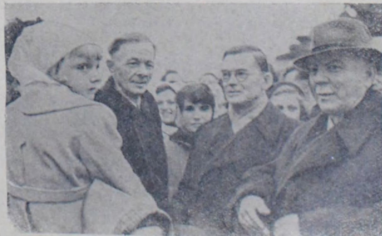
Польша. Пребывание в Варшаве Председателя Президиума Верховного Совета СССР К. Е. Ворошилова. На снимке: К. Е. Ворошилов и Председатель Государственного совета Польской Народной Республики А. Завадский среди варшавян.

Дружеский визит К. Е. Ворошилова и других советских деятелей в Польскую Народную Республику послужит дальнейшему укреплению дружественных отношений Советского Союза с Польской Народной Республикой и будет способствовать совместной борьбе за смягчение международной напряженности, за упрочение мира во всем мире.